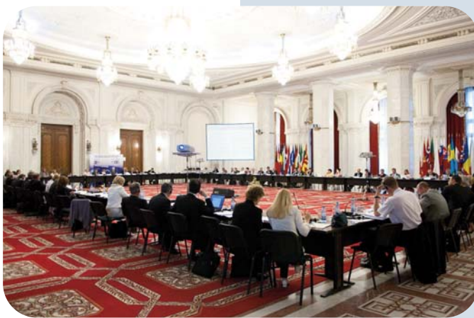
■ The General Assembly adopts the resolution on Transparency and Access to Justice/L'Assemblée générale adopte la résolution sur la transparence et l'accès à la justice.

La prochaine Assemblée générale aura lieu à Londres du 2 au 4 juin 2010. Encore tous nos remerciements au CSM de Roumanie pour l'accueillante hospitalité et pour l'organisation remarquable de l'Assemblée générale de cette année.