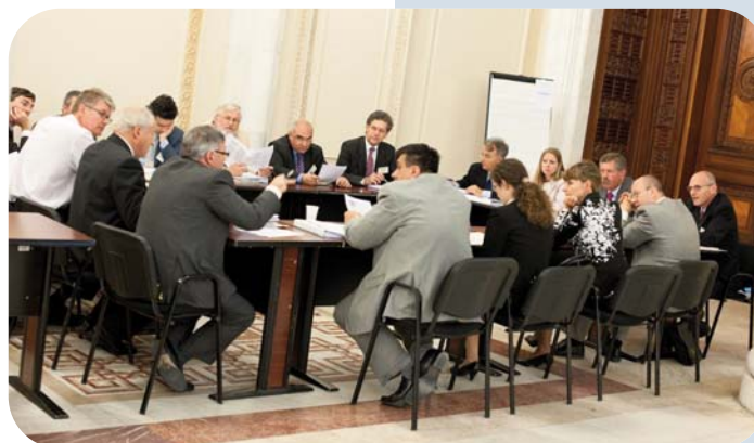
■ A subgroup discussing the resolution Un sous-groupe qui discute la résolution

L A DERNIÈRE réunion de l'Assemblée générale, qui a eu lieu du 27 au 29 mai dernier à Bucarest, a été caractérisée par un débat fructueux et plusieurs décisions importantes ont été prises.