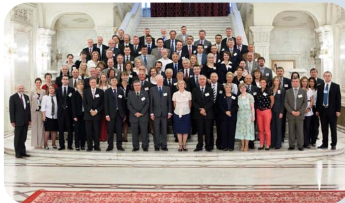
■ Group photo of the participants and organizers of the ENCJ General Assembly/Photo de groupe des participants et organisateurs de l'Assemblée générale du RECJ