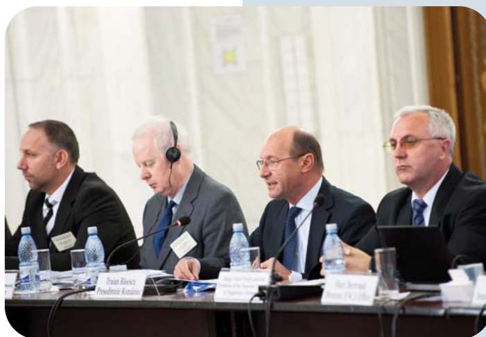
■ Mr. Traian Băsescu addressing the ENCJ General Assembly M. Traian Băsescu s'adresse à l'Assemblée générale du RECJ

In May our General Assembly meeting was held in Bucharest. It was characterized by a very amicable and harmonious atmosphere during which important decisions were taken for the future of our Association.