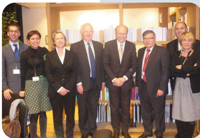
■ Executive Board Members and ENCJ staff visiting the Court of Justice of the European Union, Luxembourg membres du Bureau exécutif et les fonctionnaires du Secrétariat du RECJ visitent la Cour de Justice de l'Union européenne à Luxembourg